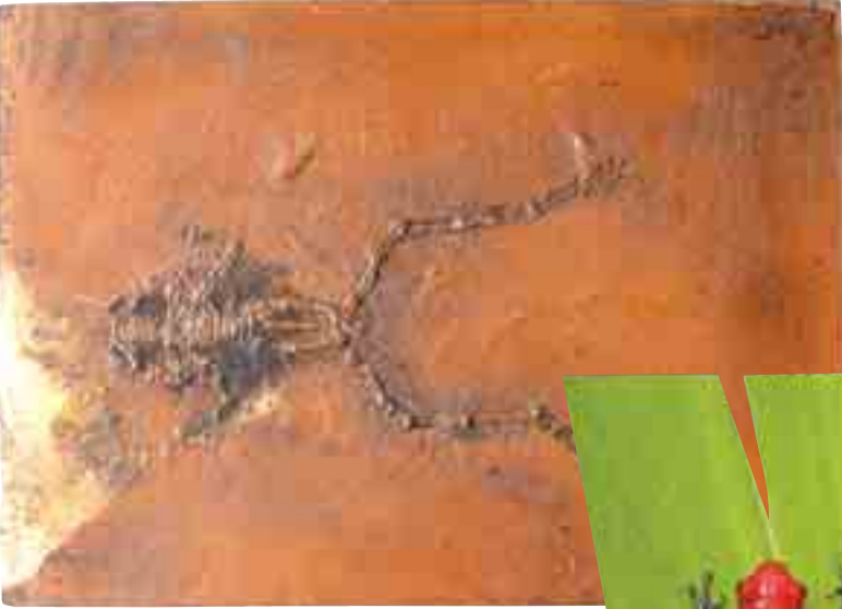
(Yukarıda) 50 milyon yıllık kurbağa fosili.

Bu kurbağa cinsinin bir kısmı arka ayaklarıyla toprağı kazarak toprak içerisinde, bir kısmı da sulu ortamlarda yaşar. Darwinistler amfibiye'nlerin sözde atasının balıklar olduğunu iddia ederler. Ancak bu iddialarını delillendirebilecek hiçbir bulguları yoktur. Tam tersine bilimsel bulgular, iki tür arasında çok büyük anatomik farklılıklar olduğunu ve birinin diğere'nden türemiş olmasının imkansız olduğunu göstermektedir. Bu bilimsel bulgulardan biri de fosil kayıtlarıdır.