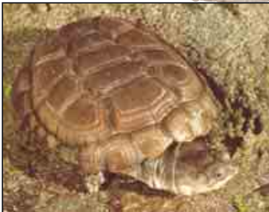
37-23 milyon yıllık kaplumbağa fosili (üstte)