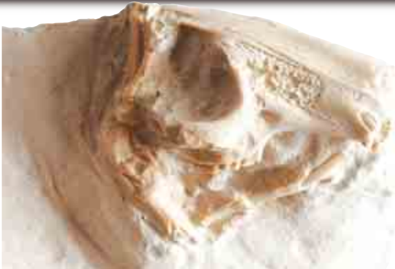
33 milyon yıllık tavşan kafatası fosili

Örümceklerin hep örümcek, arıların hep arı, vatozların hep vatoz olması gibi tavşanlar da hep tavşan olarak var olmuşlardır. Evrimin geçersizliğini gösteren sayısız fosil bulgusu karşısında, Darwinistlere düşen yenilgiyi kabul etmektir. Resimdeki 33 milyon yıllık tavşan fosili de, Darwinistlerin yenilgisini bir kez daha vurgulamakta, tüm canlıları Rabbimiz olan Allah'ın yarattığı gerçeğini göstermektedir.